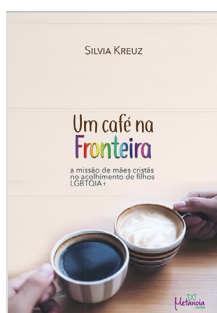
Um café na fronteira - a missão de mães cristãs no acolhimento dos filhos LGBTQIA+ Silvia Kreuz. Editora Metanoia, 2022