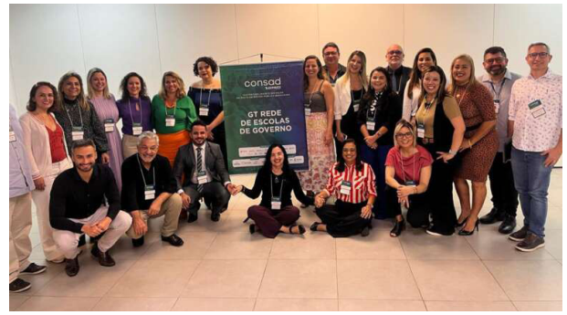
Participantes das escolas de governo do Brasil. CONSAD Express Manaus – 2023.

Os alunos são assistidos pela lei do estagiário e recebem uma bolsa estágio, além do auxílio-transporte, concedidos pela Secretaria da Educação do Estado (Seduc-CE). Pelo programa, o Governo do Estado do Ceará, por meio da Seduc, seleciona estudantes de nível técnico de escolas públicas para atuarem em órgãos e entidades estatais, garantindo oportunidades de emprego e renda para os jovens cearenses.