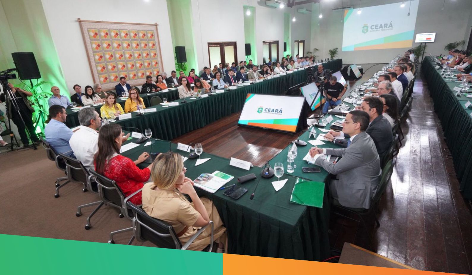
Momento da apresentação do balanço do primeiro semestre de gestão