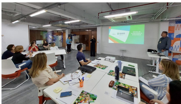
Oficina de Planejamento Estratégico no espaço multiuso do Laboratório Íris