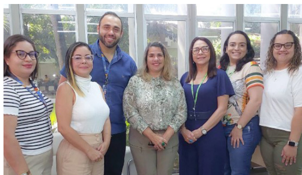
Representaram a Escola de Formação de Maceió e da Escola de Gestão Pública do Estado do Ceará – EGPCE