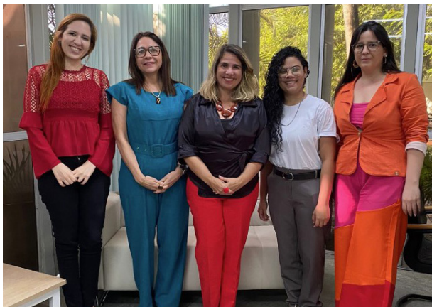
Representantes da Vara de Execução de Penas e da Escola de Gestão Pública do Estado do Ceará – EGPCE