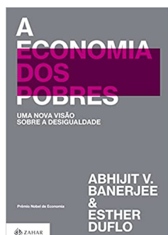
A Economia dos Pobres Abhijit V. Banerjee & Esther Duflo. Editora Zahar, 1ª edição, 2021.