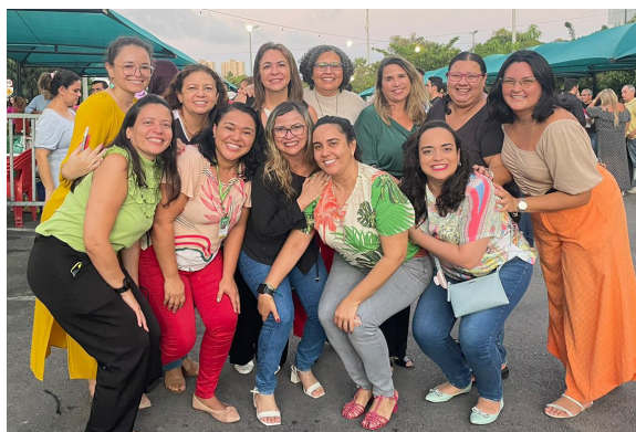
Alguns momentos da Equipe EGPC durante as atividades da Semana do Servidor Público 2023.