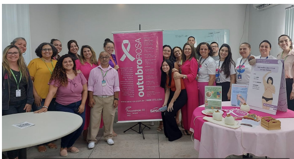
Equipe EGPCE e equipe Sesc